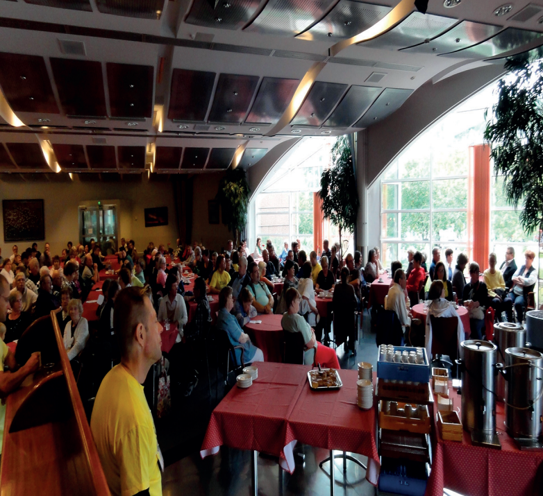
Avajaiskahvit, läsnä 210 henkilöä