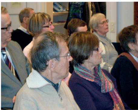
NX esittelyn yleisöä